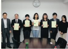
【東京・初任者】修了式