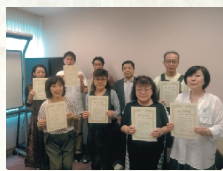
【北海道・初任者】修了式